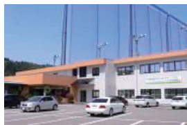
古沢ゴルフクラブ (富山市)