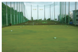
ゴルフ練習場アンテロープ (魚津市)